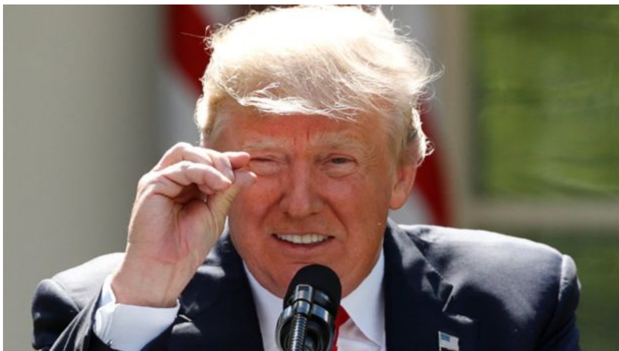
Donald Trump indica lo que piensa que ha cambiado el clima cuando anunció el retiro de EE.UU. del Acuerdo de París.

El Acuerdo de París fue firmado por 195 países en diciembre de 2015, con el fin de reducir las emisiones de gases con efecto invernadero y ayudar a las naciones más pobres a adaptarse a un planeta que ya ha cambiado.